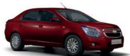
Қою қызыл / Бордовый