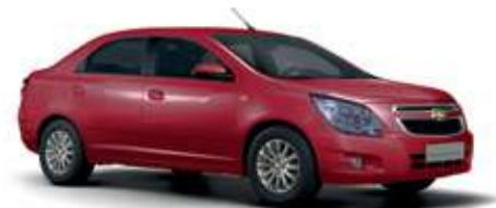
Күрең қызыл / Темно-вишнёвый