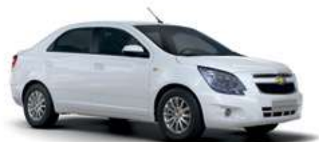
Сұрғылттау ақ / Бело-дымчатый