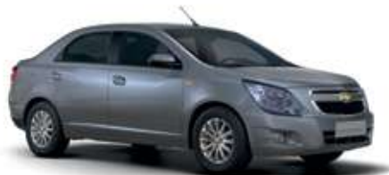
Сұр / Серый