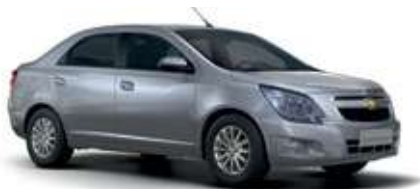
Күміс түстес / Серебристый